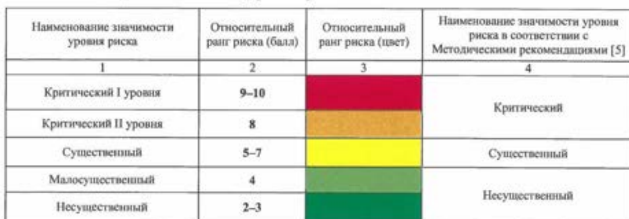
Таблица 4. Значимость уровня риска

6.3.9. Риски по значимости их уровня подразделяются на критические I уровня, критические II уровня, существенные, малосущественные и несущественные. Критические и существенные риски образуют группу ключевых рисков. Значимость уровня риска необходимо определять в соответствии с Таблицей 4.