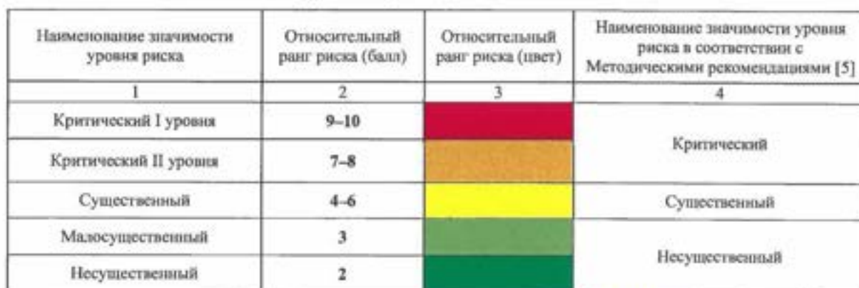
Таблица 6. Значимость уровня риска

6.4.9. Риски по значимости их уровня подразделяются на критические I уровня, критические II уровня, существенные, малосущественные и несущественные. Критические и существенные риски образуют группу ключевых рисков. Значимость уровня риска необходимо определять в соответствии с Таблицей 6.