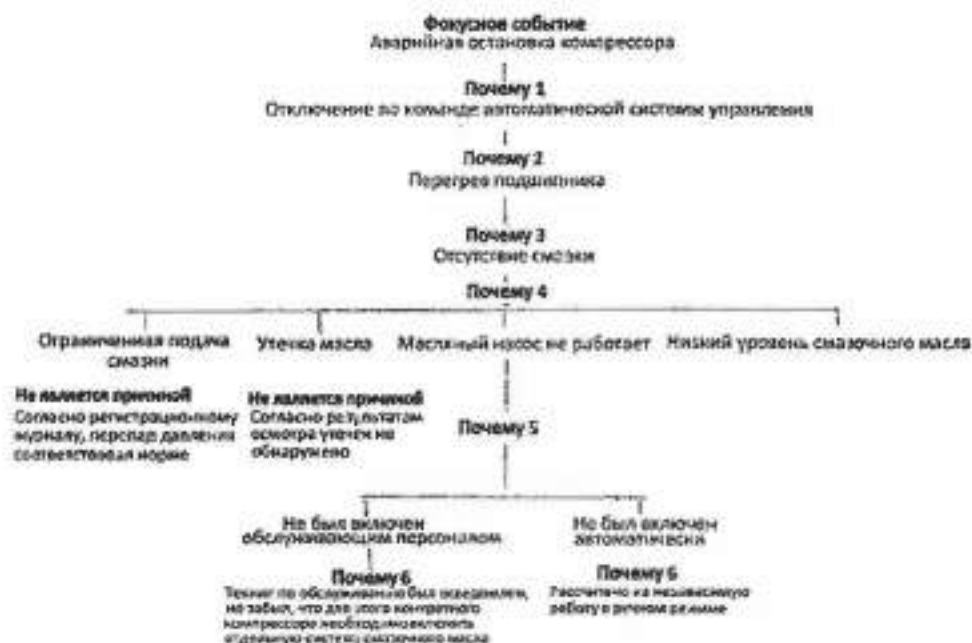
Рисунок 1.6. Пример применения метода «Почему»

5.3. Если вопрос «почему» приводит к выявлению нескольких причинных факторов, то каждый из этих факторов рассматривают отдельно, в результате чего создается древовидная схема «Почему».