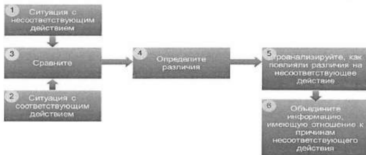
Рисунок 1.3. Порядок проведения анализа изменений